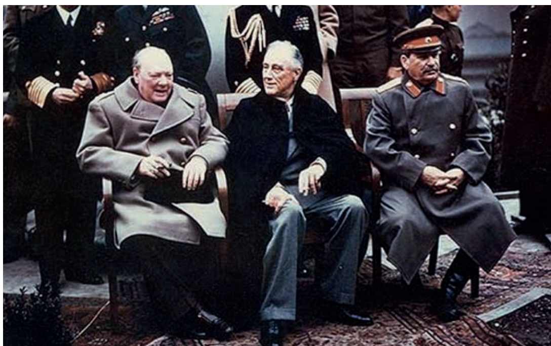
Wielka trójka na konferencji jałtańskiej, od lewej osoby siedzące: Churchill, Roosevelt i Stalin.

Od 1941 roku główny ciężar prowadzenia wojny z Niemcami na europejskich frontach spoczywał na barkach ZSRR . To spowodowało, że Zachód ulegał Stalinowi i był gotów nas poświęcić, byle tylko utrzymać antyhitlerowski sojusz. Już w 1943 roku, na konferencji wielkiej trójki ( Stalin – przywódca ZSRR, Churchill – premier